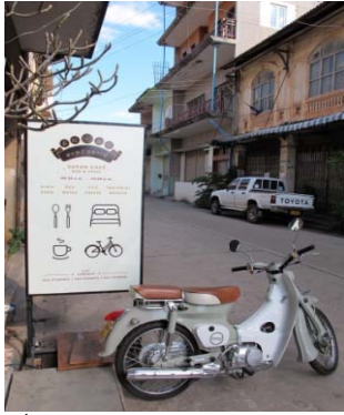
ที่มา : A Remarkable Journey

Trip ได้ดี คือ ร้านอาหาร ร้านกาแฟและเบเกอรี่ สอดคล้องกับสถิติร้านอาหารในสะหวันนะเขตปี 2559 เพิ่มจำนวนมากกว่า 100% ภายใน 1 ปี เป็น 143 แห่ง จาก 71 แห่งในปี 2558 และยังมีโอกาสเติบโตได้อีกมาก สะท้อนจากจำนวนนักท่องเที่ยวที่สูงกว่าหลวงพระบางราว 30% แต่ยังมีร้านอาหารน้อยกว่าหลวงพระบางถึง 3 เท่า นอกจากนี้ เป็นที่น่าสังเกตว่า ร้านอาหารและร้านกาแฟส่วนใหญ่นิยมตกแต่งร้านสไตล์โบราณ (Antique) ให้เข้ากับบรรยากาศ Slow Life ของเมือง นอกจากนี้ บางร้านยังมีบริการให้เช่าจักรยาน จักรยานยนต์ และที่พักแก่นักท่องเที่ยวอีกด้วย อย่างไรก็ตาม ในส่วนของธุรกิจโรงแรมนับว่ายังมีโอกาสไม่มากนัก เนื่องจากนักท่องเที่ยวไม่นิยมค้างแรมหลายวัน สะท้อนจากอัตราเข้าพักโรงแรมในสะหวันนะเขตที่มีเพียง 53% ธุรกิจโรงแรมจึงอาจยังไม่ใช่ทางเลือกที่เหมาะสมมากนักสำหรับสะหวันนะเขตในปัจจุบัน