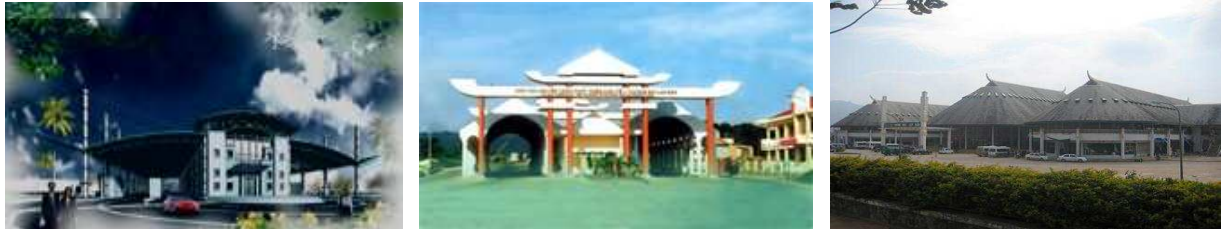
บริเวณโดยรอบเขตเศรษฐกิจพิเศษ Lao Bao

รัฐบาลเวียดนามมีนโยบายดึงดูดการลงทุนให้เข้ามาในเขตเศรษฐกิจพิเศษ Lao Bao ด้วยการให้สิทธิประโยชน์ต่าง ๆ อาทิ