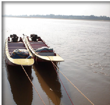
เรือเร็ว