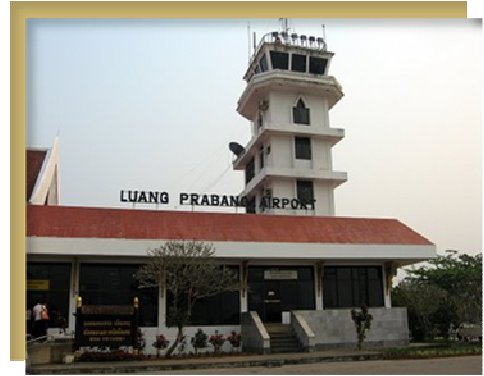
ท่าอากาศยานนานาชาติหลวงพระบาง