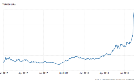
ค่าเงิน Lira เทียบกับเงินดอลลาร์สหรัฐฯ อ่อนค่ามากที่สุดเป็นประวัติการณ์