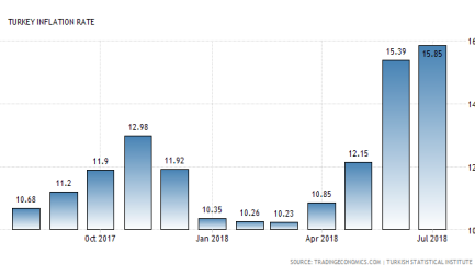
อัตราเงินเฟ้อของตุรกีเพิ่มขึ้นแตะระดับสูงสุดในรอบ 14 ปี