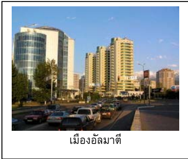
เมืองอัลมาตี

• เมืองอัลมาตี (Almaty) เป็นเมืองหลวงเก่าของคาซัคสถาน และเป็นเมืองที่มีขนาดใหญ่ที่สุดในคาซัคสถาน ปัจจุบันยังคงเป็นเมืองสำคัญทางเศรษฐกิจ การเงิน และวัฒนธรรม รวมถึงศูนย์กลางทางการค้าและการท่องเที่ยวของคาซัคสถาน โดยรัฐบาลได้เร่งก่อสร้างและพัฒนาศูนย์ธุรกิจต่าง ๆ ตลอดจนระบบสาธารณูปโภคของเมืองนี้อย่างต่อเนื่อง ล่าสุด รัฐบาลคาซัคสถานได้อนุมัติงบประมาณประจำปี 2550 ราว 1 พันล้านดอลลาร์สหรัฐ เพื่อใช้พัฒนาเมืองอัลมาตี นอกจากนี้ การก่อสร้างที่พักอาศัยระดับหรู อาคารสำนักงาน และแหล่งบันเทิง ยังได้รับความนิยมเพิ่มขึ้น ทำให้คาดว่าธุรกิจก่อสร้างในเมืองอัลมาตีจะมีแนวโน้มสดใสและมีโอกาสเติบโตได้อีกมาก