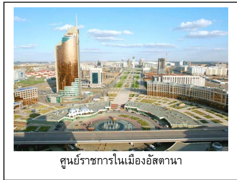
ศูนย์ราชการในเมืองอัสตานา

- การก่อสร้างสถานที่ราชการและที่พักอาศัย ศูนย์การค้าและการลงทุน ระบบสาธารณูปโภค ตลอดจนระบบคมนาคม ซึ่งในเบื้องต้นรัฐบาลคาซัคสถานได้อนุมัติงบประมาณก่อสร้างแล้วราว 6 พันล้านดอลลาร์สหรัฐ