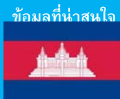
ข้อมูลที่น่าสนใจ

ส่วนวิจัยธุรกิจ 1 ฝ่ายวิจัยธุรกิจ ธนาคารเพื่อการส่งออกและนำเข้าแห่งประเทศไทย