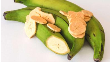
Fried Ripe Plantains

เป็นพืชในสกุลเดียวกับกล้วย พบบ้างมากในทวีปแอฟริกา มีแป้งมากกว่า และมีน้ำตาลน้อยกว่ากล้วย ชาวแอฟริกา นิยมนำมาประกอบอาหาร