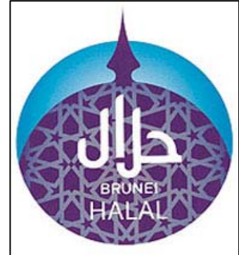
ตราสัญลักษณ์ฮาลาลของบรูไน

☺ อาหารและผลิตภัณฑ์ โดยเฉพาะอาหารแปรรูปและอาหารพร้อมรับประทาน อาทิ อาหารทะเลกระป๋องและแปรรูป ผลไม้กระป๋องและแปรรูป ผักกระป๋องและแปรรูป และไอศกรีม เป็นต้น เนื่องจากการผลิตของบรูไนยังไม่เพียงพอ ทำให้บรูไนต้องพึ่งพาการนำเข้าสินค้าอาหารจำนวนมากจากต่างประเทศ ประกอบกับพฤติกรรมและรสนิยมการบริโภคของชาวบรูไนที่เปลี่ยนแปลงไป กล่าวคือปัจจุบันชาวบรูไนมีวิถีชีวิตที่เร่งรีบและต้องการความสะดวกสบายมากขึ้น ขณะที่สินค้าอาหารของไทยมีความได้เปรียบด้านคุณภาพและมาตรฐานการผลิตที่ได้รับการยอมรับจากชาวบรูไน ทั้งนี้ สินค้าอาหารและผลิตภัณฑ์ที่วางจำหน่ายในบรูไนควรได้รับการรับรอง